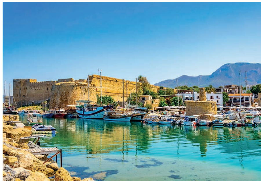
▲ Kirenia, zamek

Najprawdopodobniej miasto zostało założone przez przybyszów z kontynentu, może już w XIII w. p.n.e. Nie bardzo wiadomo, skąd pochodzi jego nazwa. Niektórzy wywodzą ją od Kerynii – nazwy góry na Półwyspie Peloponeskim. Turecka nazwa, Girne, pochodzi od nazwy greckiej (via Gerines, można spotkać w XVI–XVII w., choć tak zwano początkowo tylko port Kireni). W V w. p.n.e. Kirenia była jednym z dziesięciu królestw istniejących wówczas na wyspie. Nie odegrała jednak szczególnej roli w starożytności. Rzymianie zwali ją