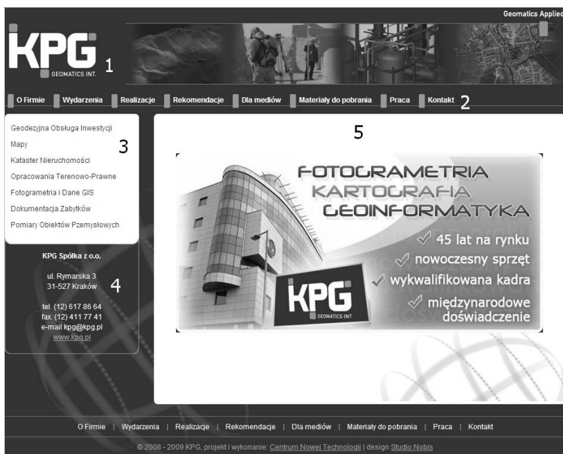
Rysunek 3.1. Kpg.pl — przykład strony firmowej

Opis do rysunku 3.1 przedstawiającego stronę www.kpg.pl firmy, która jest czołowym dostawcą usług geodezyjnych w Polsce: