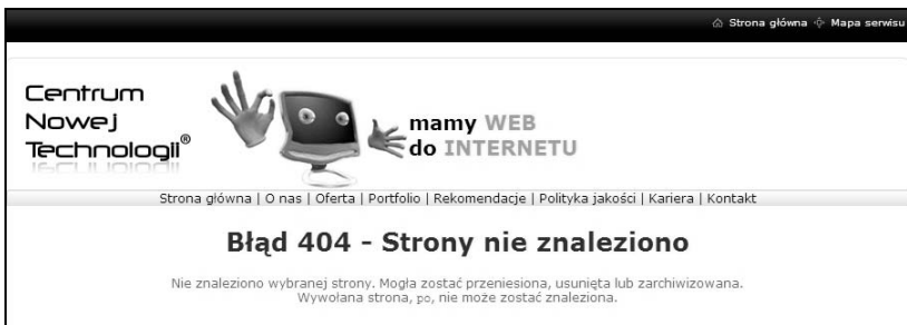
Rysunek 3.4. Jak radzić sobie z błędem 404

gdy wpisze błędnie adres strony. Takie złe wrażenie można jednak zniwelować. Wystarczy, że pod adres domeny ustawisz wyświetlanie się góry strony wraz z menu, bez względu na to, jaki nieprawidłowy adres podstrony by się wpisało w pasek przeglądarki. Posłużę się przykładem strony mojej firmy. Portfolio jest dostępne pod adresem www.cntech.pl/portfolio , lecz gdyby podczas wpisywania adresu namieszał jakiś chochlik i zamiast „portfolio” byłoby słowo „portolio”, pojawi się strona z naszym logo, hasłem, menu oraz standardowym komunikatem, że strona nie została odnaleziona (rysunek 3.4). Dzięki widocznemu i aktywnemu menu można próbować ją odnaleźć. Przede wszystkim jednak użytkownik otrzymuje jasny sygnał: strona wciąż działa, co w przypadku strony firmowej oznacza: „jeszcze się nie zwinęli”.