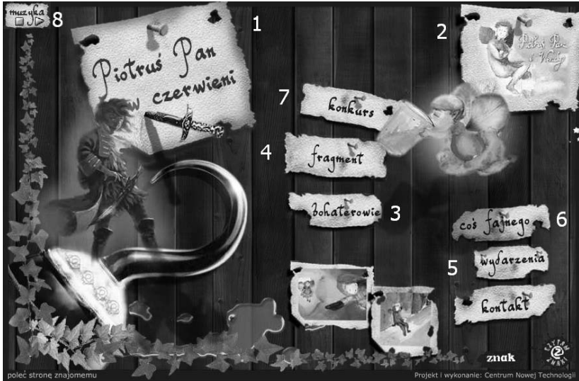
Rysunek 3.2. Piotruspan.znak.com.pl — przykład strony produktowej

unowocześniające produkt), instrukcje obsługi (nie każdy lubi przechowywać pudełka z instrukcją do produktu), ciekawe dodatki stanowiące wartość dodaną, np. tapety na pulpit komputera.