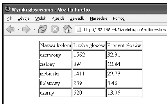
Rysunek 3.4. Tabela zawierająca wyniki ankiety

Po otwarciu pliku za pomocą funkcji fread odczytywane są jego kolejne wiersze. Pierwszy wiersz zawiera informację o liczbie głosów oddanych na kolor czerwony, drugi o liczbie głosów oddanych na kolor zielony itd. Odczytane wartości poddawane są konwersji do typu int (odpowiadają za to wywołania funkcji intval) i przypisywane zmiennym: $czerwony, $zielony, $niebieski, $fioletowy i $czarny. Całkowita liczba oddanych głosów jest zapisywana w zmiennej $votes_no, wartość ta jest następnie wykorzystywana do obliczenia, jaki procent głosów uzyskał każdy z kolorów. Do obliczenia procentowego udziału głosów wykorzystywany jest wzór: