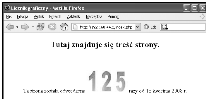
Rysunek 3.2. Licznik odwiedzin w formie graficznej

function getHits() { if((($fp = @fopen("counter.txt", "r+")) === false) return false; $count = fgets($fp); $count = $count + 1; fseek($fp, 0); fputs($fp, $count); fclose($fp); $count = strval($count); $strLength = strlen($count); $imgStr = ""; for($i = 0; $i < $strLength; $i++){ $temp = $count[$i]. '.jpg'; $imgStr .= "<img src=\"\$temp\" alt=\"{\$count[$i]}\">"; } return $imgStr; } echo(getHits()); ?> razy od 18 kwietnia 2008 r. </div> </body> </html>