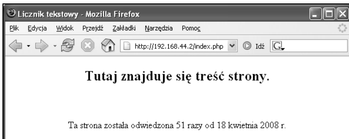
Rysunek 3.1. Działanie licznika tekstowego

Uruchomienie tego skryptu spowoduje pojawianie się strony jak na rysunku 3.1. Jak widać, realizacja najprostszego licznika nie powinna sprawić kłopotu nawet początkującym programistom. Należy jedynie pamiętać, aby ustawić uprawnienia pliku counter.txt , tak aby PHP miał możliwość jego odczytu i zapisu.