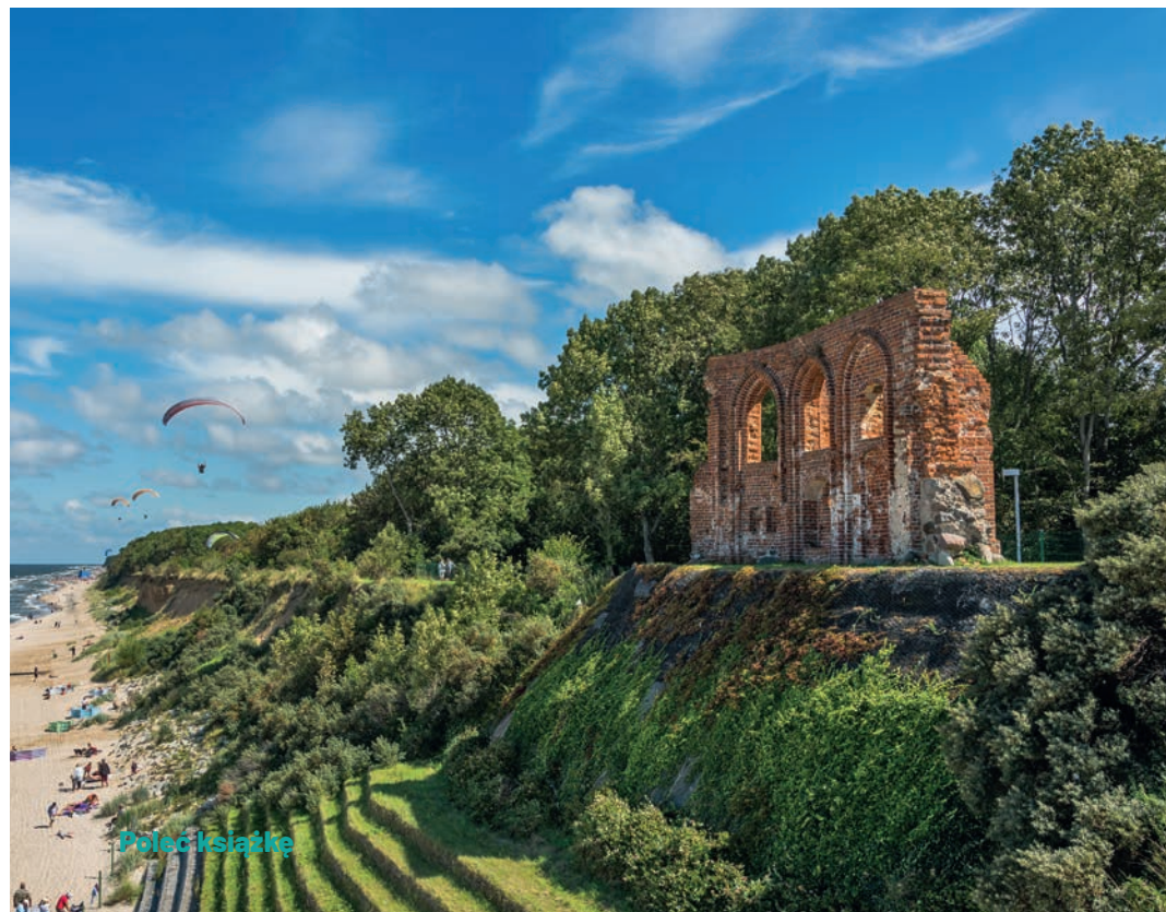
● Ruiny kościoła w Trzęsaczu

Kościół św. Mikołaja w Trzęsaczu powstał na przełomie XIV i XV w., i to w środku wsi, blisko 2 km od wybrzeża! To, że dziś podziwiamy tylko jedną ze ścian, wynika z procesów erozyjnych, konkretnie z abrazji. Polega ona na podmywaniu brzegów przez morskie fale – niewielkie fragmenty skalne niesione przez sztormy uderzają w wybrzeże, powodują jego niszczenie i tym samym tworzenie się klifu. 400 lat temu budowniczości świątyni nie mogli przewidzieć, że z upływem czasu ich miejscowość utraci tyle terenu – rokrocznie nawet 2 m. W 1750 r., kiedy morze niebezpiecznie zbliżyło się do świątyni, próbowano powstrzymać proces abrazji przez umacnianie klifu. Sztormy okazały się jednak znacznie silniejsze od ówczesnej techniki i proces wciąż postępował. W 1868 r. kościół znajdował się już tylko metr od przepaści. Ostatnie nabożeństwo zostało tu odprawione 2 III 1874 r., po czym świątynię zamknięto, a wyposażenie przeniesiono m.in. do katedry w Kamieniu Pomorskim. Kolejne fragmenty kościoła wpadały do morza w latach 1903, 1909, 1913, 1917, 1922, 1930, 1956, 1973 i 1994.