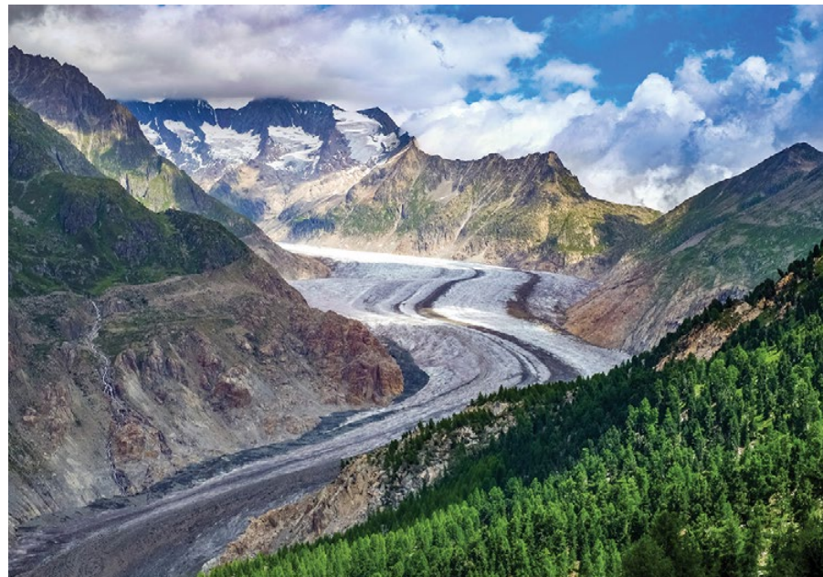
▲ Lodowiec Aletsch

Górną część doliny Lauterbrunnen obejmuje rezerwat przyrody. Masyw Jungfrau wraz z lodowcem Aletsch i szczytem Bietschhorn zostały wpisane na listę światowego dziedzictwa UNESCO. Pierwszego wejścia na tę imponującą górę